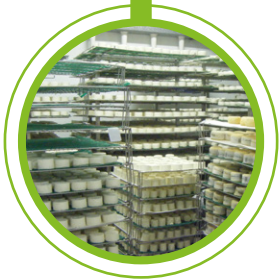
EMPRESAS DE PRODUÇÃO DE QUEIJOS