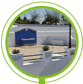
FONTE DE CARCAVELOS