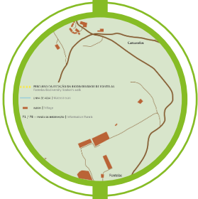
ESTAÇÃO DA BIODIVERSIDADE