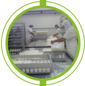
EMPRESAS DE PRODUÇÃO DE QUEIJOS